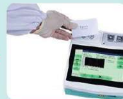
3. Ingreso de datos de CI