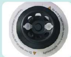
1. Centrifugar la muestra